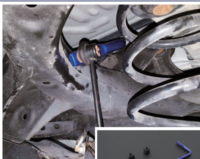
7692 (19mm) 後防傾桿 2WD