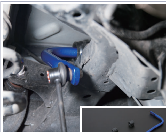
7028 (22mm) 後防傾桿 4WD