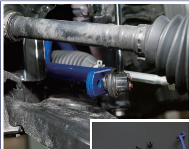
7691 (25.4mm) 前防傾桿