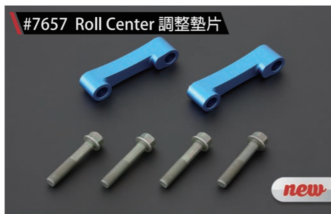
#7657 Roll Center 調整墊片

安裝於前下仰角及三角架球頭處，主要作用為墊高仰角使車身下降，並使仰角往前移的設計並改變caster角度，減少因為車身下降後可能產生的轉向干涉的情形