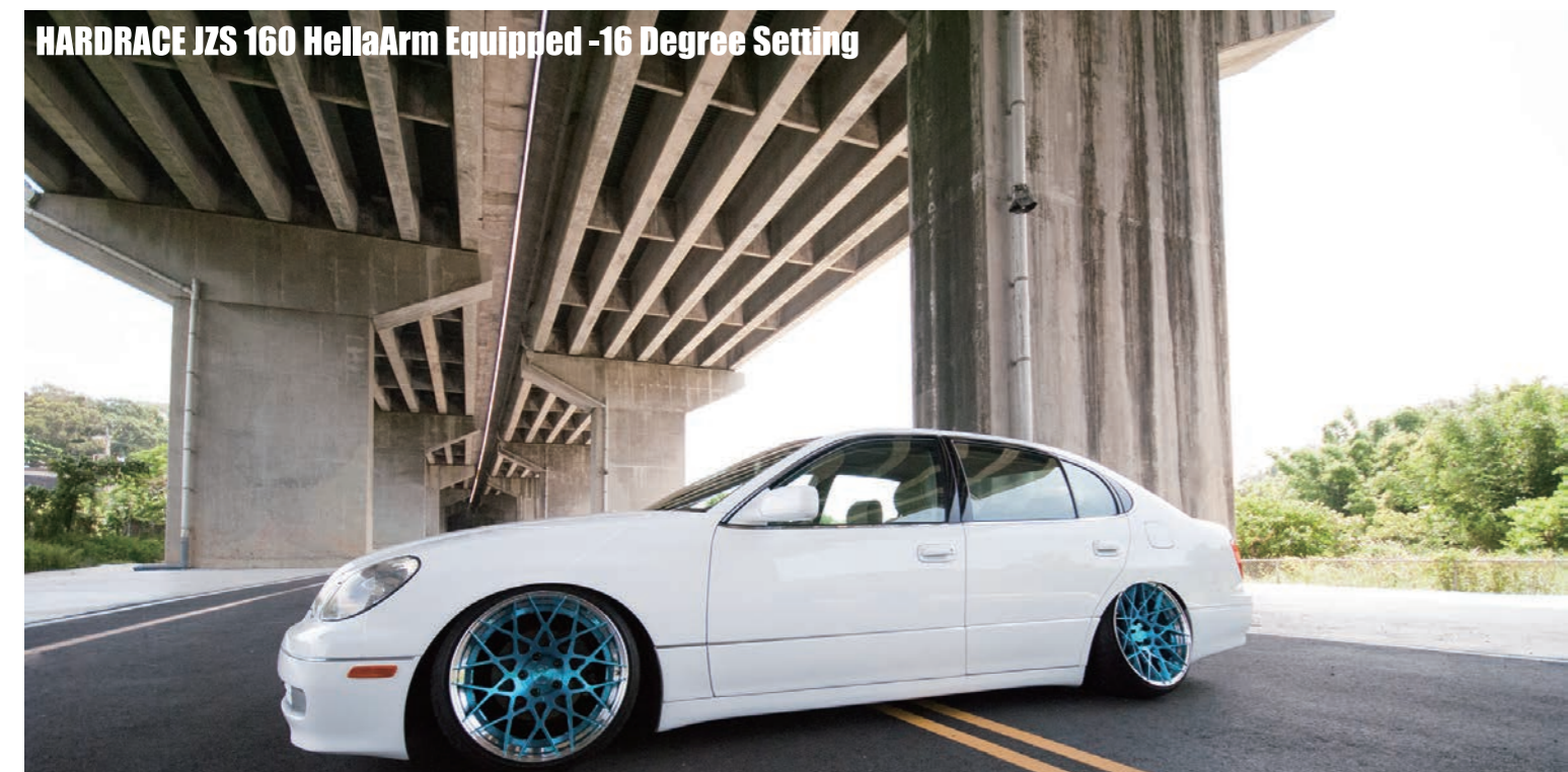
HARDRACE JZS 160 HellaArm Equipped -16 Degree Setting

後束角調整器，兩端可調設計並搭配強化的魚眼鏡套與球頭，能輕易地調整輪胎束角的角度，以配合車高的降低設定